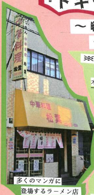
多くのマンガに登場するラーメン店