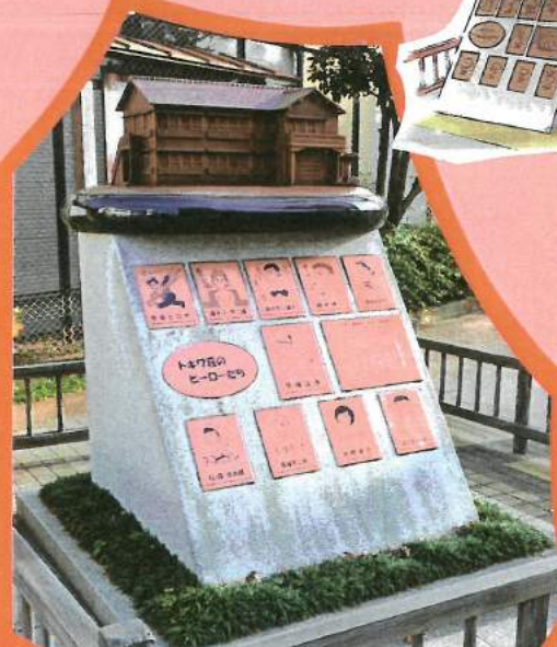
平成21年に記念碑 「トキワ荘のヒーローたち」 が設置されました 〔南長崎3-9-22〕