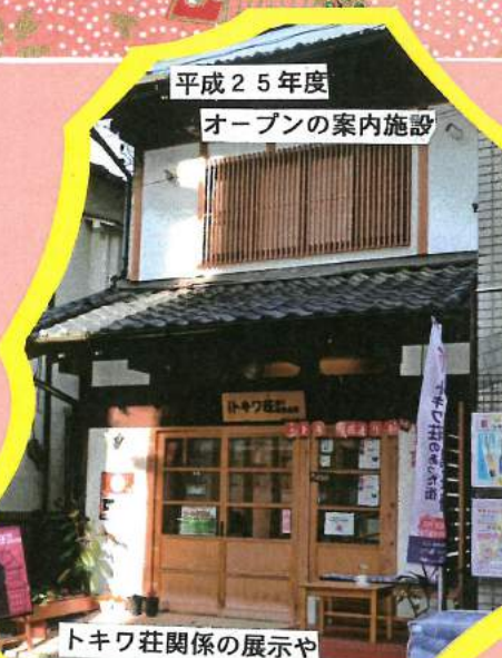
平成25年度 オープンの案内施設