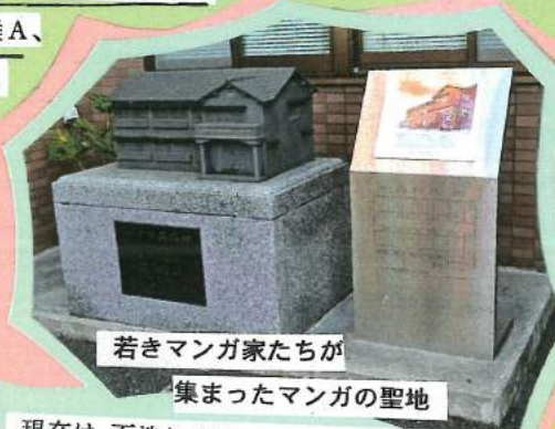
若きマンガ家たちが集まったマンガの聖地 現在は 石造りのモニュメントがあります 〔南長崎3-16-6〕