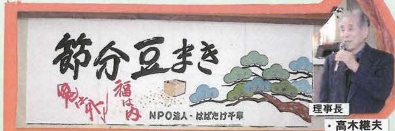
★日時:平成27年2月3日(火)