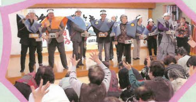
* 来年の年男は? 年女は?