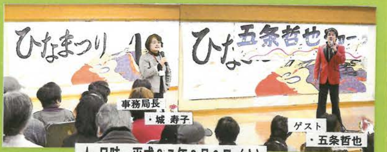
★日時:平成27年3月3日(火)