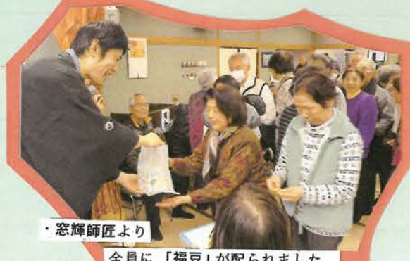
・窓輝師匠より 全員に「福豆」が配られました