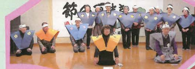
・今年も 年男 年女(13名)が選ばれ「城事務局長」により 《幸福と長寿》の祝いの口上が述べられました。